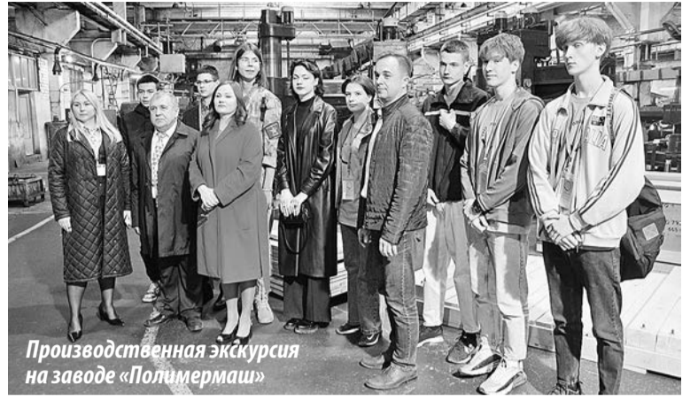
Производственная экскурсия на заводе «Полимермаш»